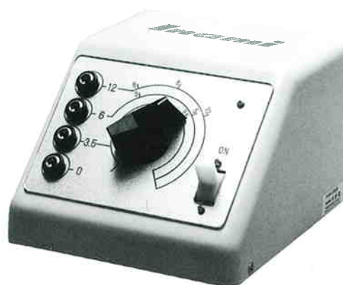
K-0402 トランスフォーマー